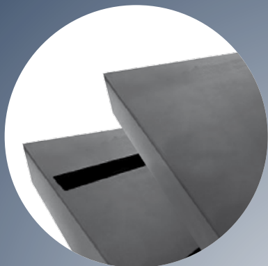
Sottovasca Under Slab Elastic Bearings